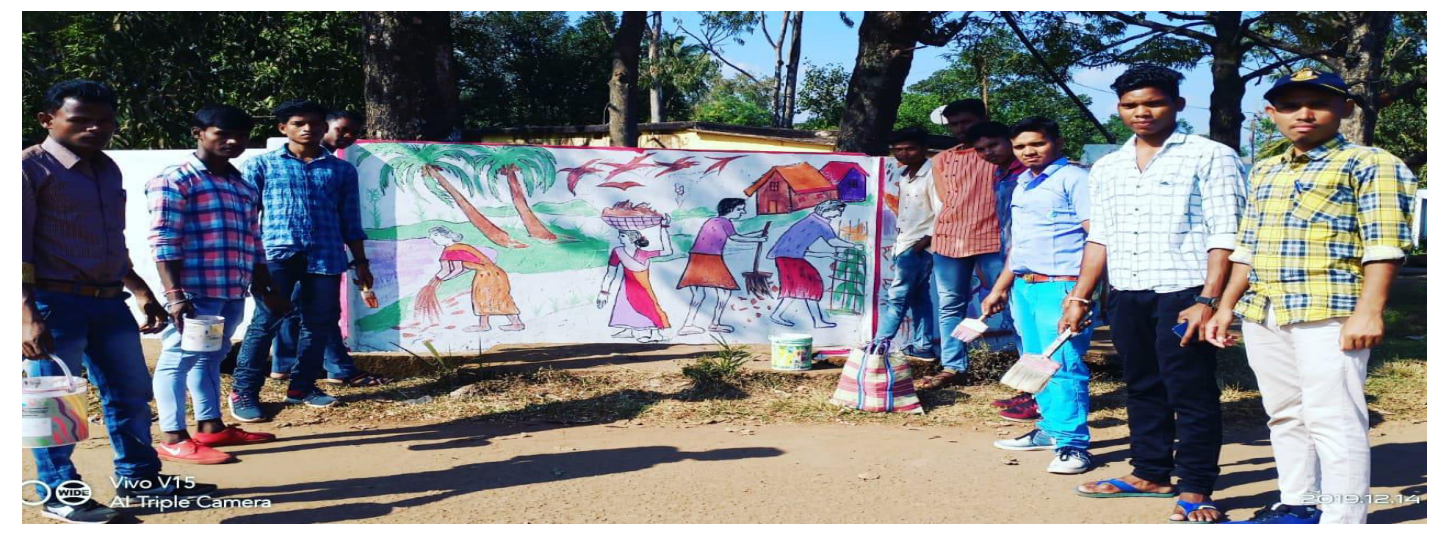
WALL PAINTING BY NCC CADETS