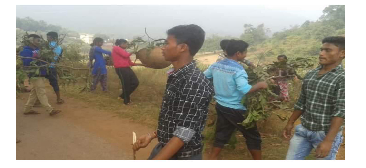
NSS VOLUNTEERS GETTING TRAINING OF MAKING DONA PATTAL FROM VILLAGERS