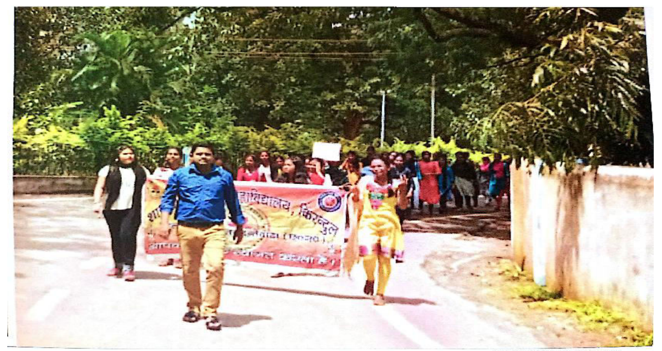
Scanned with CamScanner