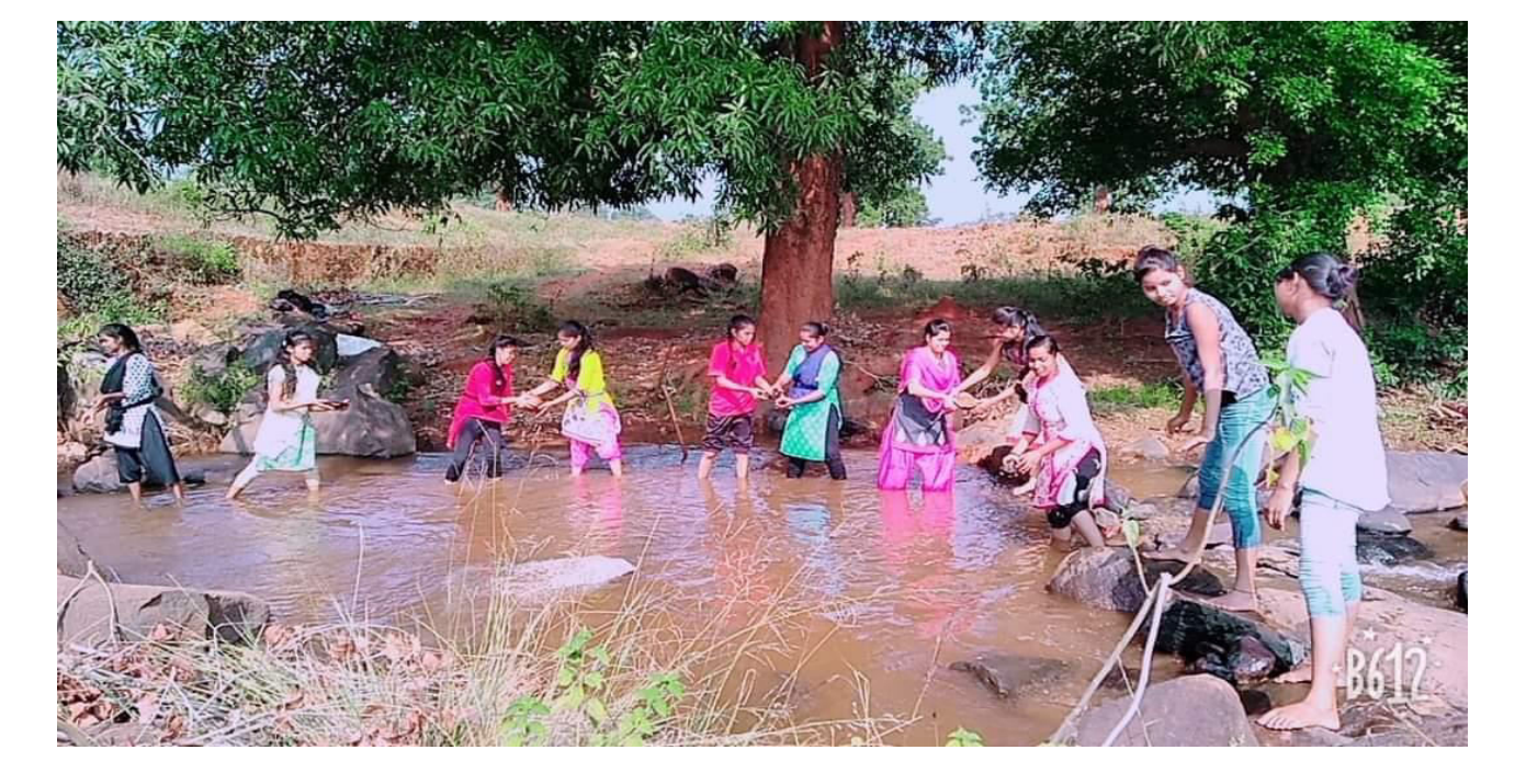
CLEANLINESS OF PADHAPUR VILLAGE BY NSS VOLUNTEERS