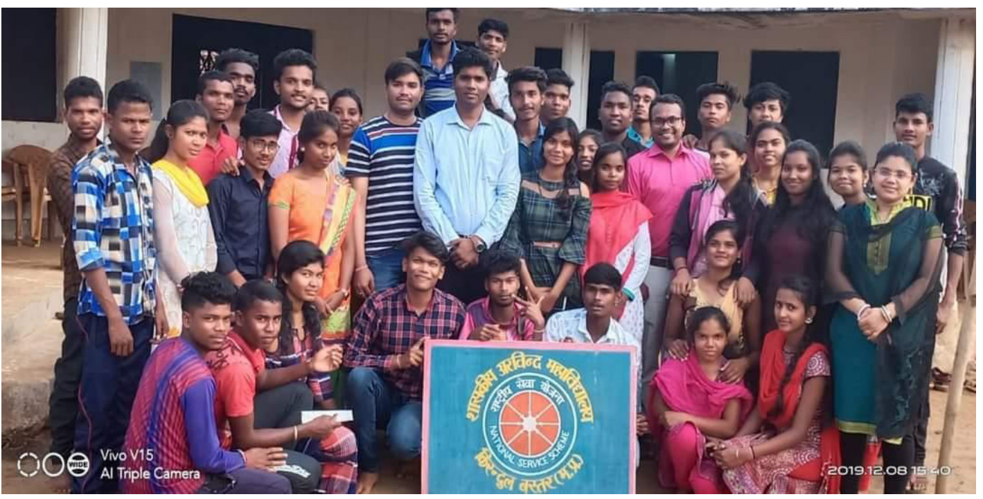
LIC OFFICER LECTURE ON CAREER IN INSURANCE FIELD