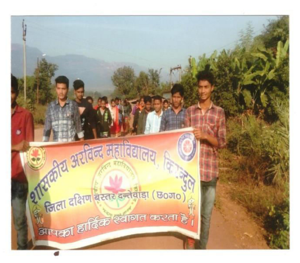
NSS CAMP PATEL PARA 2017