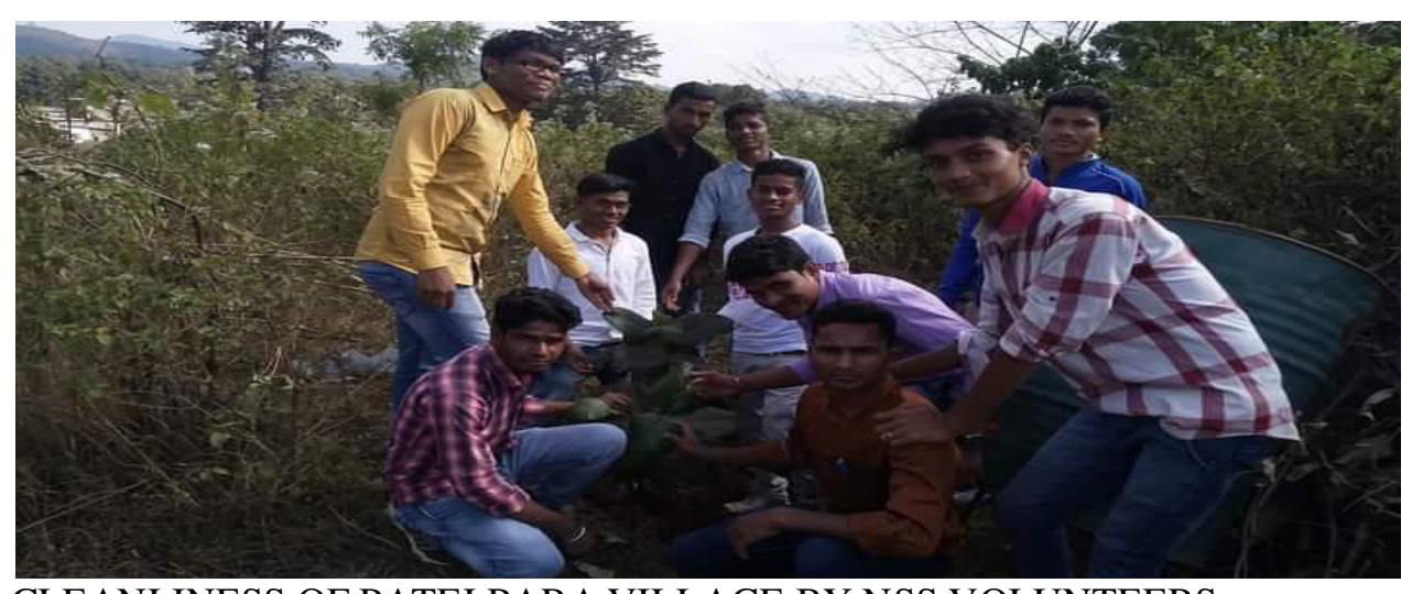
CLEANLINESS OF PATELPARA VILLAGE BY NSS VOLUNTEERS